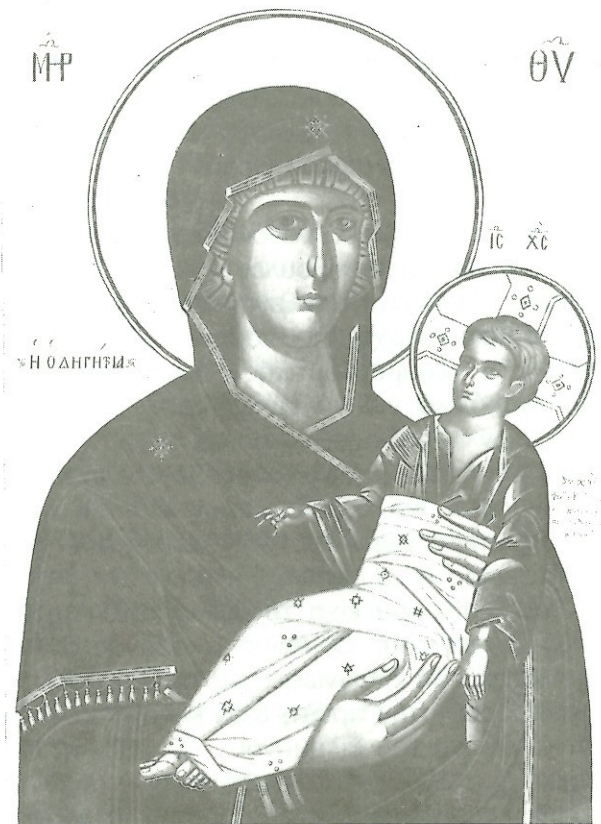
Μήτηρ Θεοῦ «Ἡ Ὁδηγήτρια».

καταυγάζει τās φρένας τῶν πιστῶν, ἐξέλκει ἀπό τό βυθό τῆς ἀγνοίας, φωτίζει πολλούς ἐν γνώσει