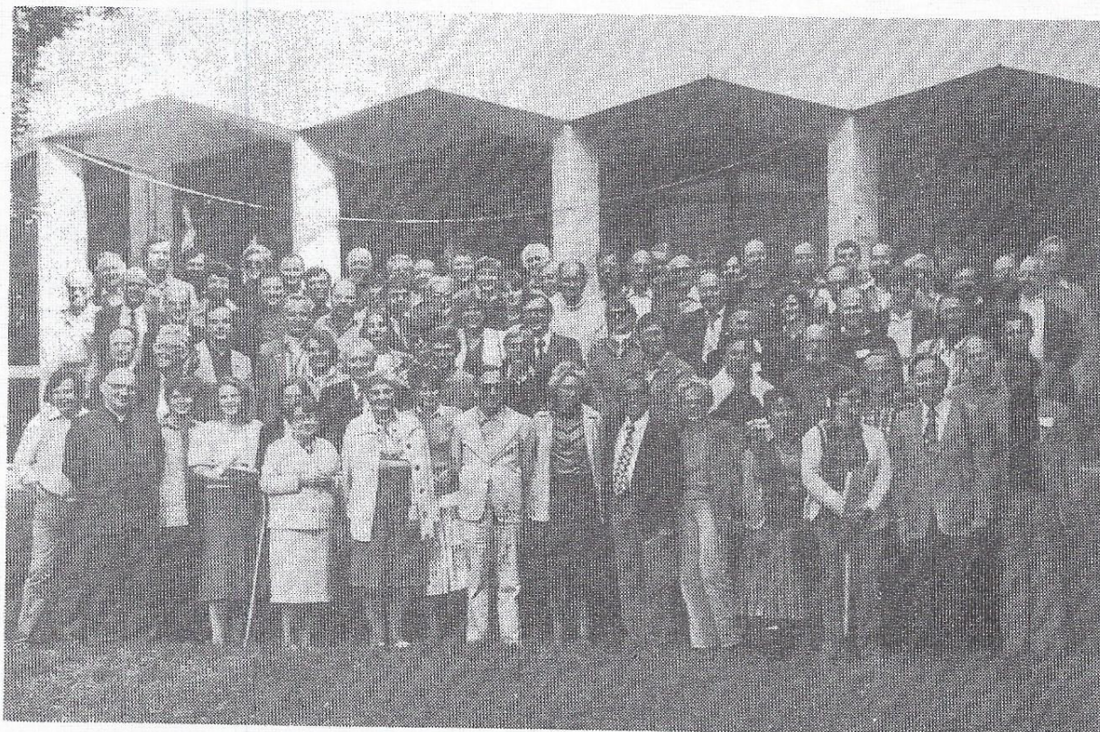
Αναμνηστική φωτογραφία των Συνέδρων που έλαβαν μέρος στην πανευρωπαϊκή οικουμενική σύσκεψη στο Λουβλίνο της Πολωνίας.