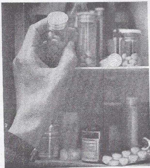
Αὐτὴ ἡ κίνηση εἶναι πάντα ἡ «λύση»;

‘Αν ἡ σχέση μετὰ τὸ Θεὸ ἐκφράζεται συνήθως ὡς «σχέση ἐξαρτήσεως», στὸν Χριστιανισμό θὰ ἔλεγα ὅτι ἀποδίδεται ὡς «σχέση κοινωνίας» τοῦ συγκεκριμένου ἀνθρώπου μετὰ τὸ συγκεκριμένο Θεό, τὸν ἐν Τριάδι, ποῦ εἶναι ἕνας, ἀλλ’ ὄχι μόνος. ‘Η κοινωνία αὐτὴ ἐπιτυγχάνεται μέσα στὸ χῶρο τῆς Ἐκκλησίας, ποῦ περιλαμβάνει ὅλους τοὺς ἀνθρώπους τοὺς ἱκανοὺς καὶ τοὺς σπουδαίους, ἀλλὰ καὶ τοὺς ταπεινοὺς καὶ καταφρονημένους. Στὸ σῶμα αὐτὸ τοῦ Χριστοῦ, ποῦ εἶναι ἡ Ἐκκλησία, χτίζεται ἡ ἀνθρωπότητα καὶ οἰκοδομεῖ τὴ σχέση της μετὰ τὸ Θεὸ ἀξονικά, γιατί αὐτὸς εἶναι ὁ ἄξονας γύρω ἀπὸ τὸν ὁποῖο στρέφεται ὁ κόσμος, ὁ ἀνθρώπος καὶ ἡ ἱστορία του. Κι ἀπ’ αὐτὸν λαμβάνει νόημα ζωῆς καὶ ἐλευθερίας.