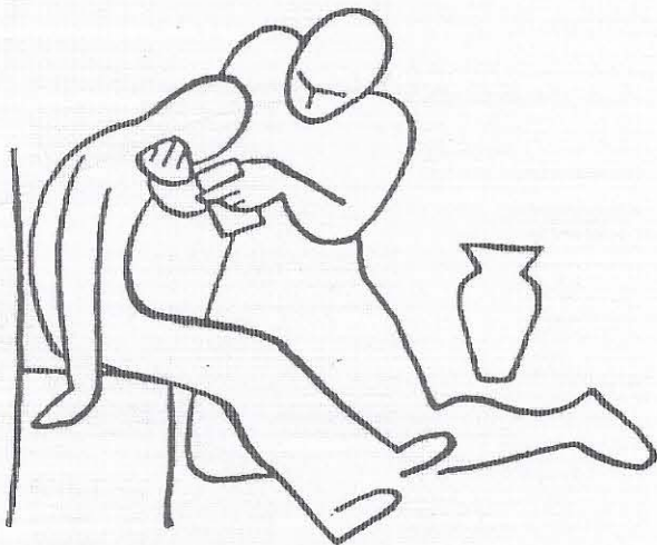
Μετάγγιση νέας ζωῆς.

Ὁ Χριστὸς ὡς ἡ ἀ π ά ν τ η σ η στὸ πρόβλημα τοῦ συγκεκριμένου ἀνθρώπου προϋποθέτει τὴν σ υ ν ά ν τ η σ η αὐτοῦ τοῦ ἀνθρώπου μὲ τὸν Χριστὸ ἢ μὲ ἐκεῖνον