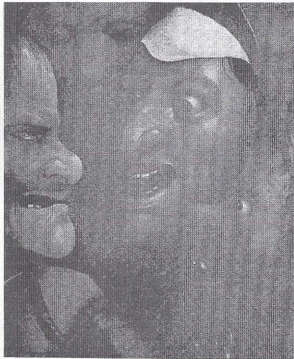
Ἡ φυγὴ τους ἀγγίζει τὸν κατώτατο ἄδη. Ἰερωνίμου Μπὸς (Bosch), λεπτομέρεια ἀπὸ τὴν «ἄρση τοῦ Σταυροῦ», Μουσεῖο Καλῶν Τεχνῶν, Γάνδη (Βέλγιο).

ἀκολούθησε ἔπειτα ἀπὸ προβολὴ ταινίας στὴν Τηλεόραση τὴν 1η Νοεμβρίου 1979, σὲ ἐρώτηση τῶν ἀρμοδίων πῶς κατάφερε νὰ ἀπαλλάγῃ ἀπὸ τὴ φοβερὴ μύστιγα τῶν ναρκωτικῶν ἔδωσε τὴν ἐξῆς ἀπάντηση: