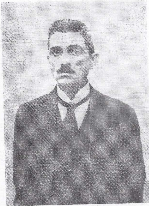
Κωνσταντίνος Θεοτόκης 1872 - 1923.