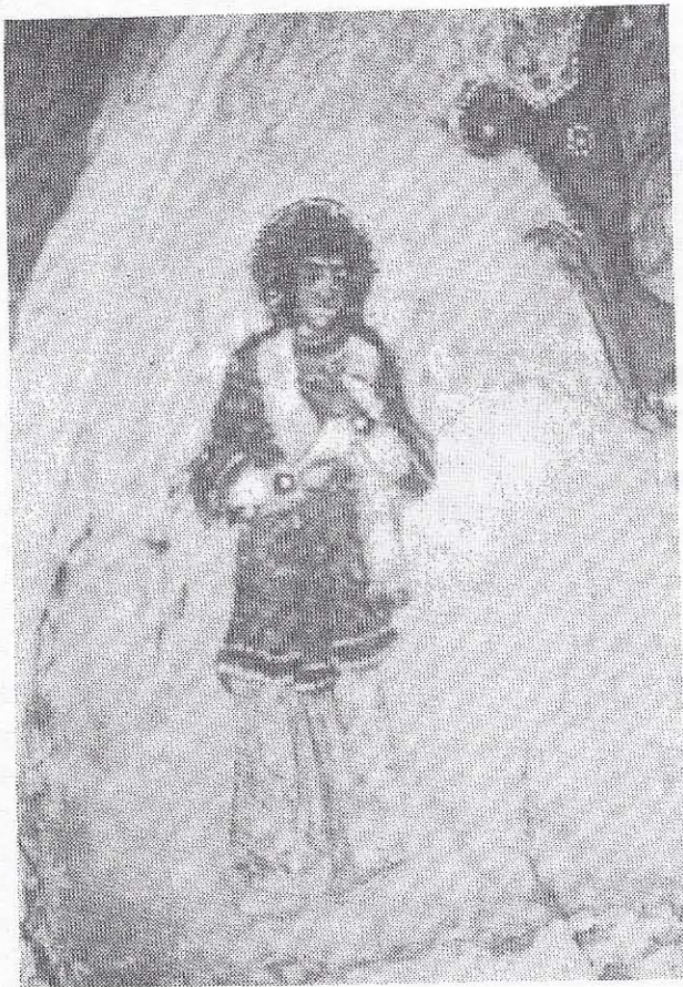
‘Ο λευκοντυμένος αρχάγγελος ἐφαινόταν πανώρως... (‘Ανάβατος, Χίου)*.

φος, «ἔβαλα ὄλη μου τὴ μπόρσση, ὄλη μου τὴν ἀγάπη, ὄλη μου τὴν πίστη· κ’ ἡ Παναγία ἄκουσε τὰ παρακάλλια μου».