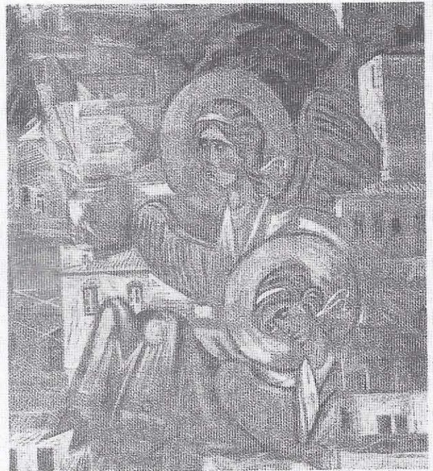
Ἄγγελοι πρωτοστατοῦν στὴν Ἀνάστασιν καὶ ἀναφωνοῦν: «Ἠγέρθη... Τί ζητεῖτε τὸν ζῶντα μετὰ τῶν νεκρῶν;». Πελαγίας Ἀγγελιοπούλου, «Υἶδρα» (λεπτομέρεια), 1983.

Μὲ ὅλα αὐτὰ ἀσφαλῶς δὲν ἐξαγλιεῖται τὸ μέγα κενό τῆς φανερώσεως τοῦ θεοῦ φωτός στὴ ζωὴ τῶν ἁγίων. Ἀναφερόμενοι σ' αὐτὸ τὸ γεγονός, θέλουμε ἀπλῶς νὰ θυμίσουμε, μὲ ἀφορμὴ τὴν ἐορτὴ τῆς Ἀναστάσεως, ὅτι «ὁ λαὸς ὁ καθήμενος ἐν σκότει εἶδε φῶς μέγα,