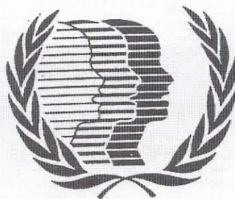
Έμβλημα για το Διεθνές Έτος Νεότητας 1985. Το φιλοτέχνησε ο Άμερικανός Αι Κάπλαν, σπουδαστής Καλών Τεχνών.

Το επίσημο έμβλημα του Διεθνούς Έτους Νεότητας 1985 σχεδιάστηκε ακριβώς για να εκφράσει τον ιδεαλισμό και τον δυναμισμό της νεότητας. Ευκίνητο και ανοιχτό, το σχέδιο προβάλλει τη συμμετοχή, την ανάπτυξη και την ειρήνη. Η συμμετοχή έχει παρασταθεί με τη χρησιμοποίηση των διαδοχικών γενικών προσώπων σε θέση προφίλ. Η ανάπτυξη, με την προσδεδειγμένη φωτοσκίαση. Η ειρήνη, προαπειτούμενος δρος για την ανάπτυξη, συμβολίζεται με τον παραδοσιακό κλάδο ελιάς του εμβλήματος των Ηνωμένων Έθνών (πρόβλ. όμως τη Γένεση η' 11). Το σχέδιο το σχεδίασε ο Lee Kaplan που σπουδάζει Καλές Τέχνες στις Ηνωμένες Πολιτείες.