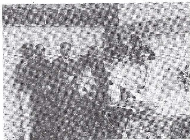
Στὸ τέλος, μετὰ τὴ χαρὰ τῆς προσφοράς στὰ πρόσωπα.

Στις 13 Νοεμβρίου 1986 πραγματοποιήσαμε μετὰ τοὺς Φοιτητές καὶ τίς Φοιτήτριες τοῦ Γ' ἔξαμήνου, στὰ πλαίσια τοῦ μαθήματος τῆς Ποιμαντικῆς, ποιμαντικὴ ἐπίσκεψη στὸ Ἀσκληπιεῖο τῆς Βούλας. Ἐκεῖ συζητήσαμε μετὰ τὸν ἐφημέριο τοῦ Νοσοκομείου γιὰ τὴν ποιμαντικὴ μέριμνα καὶ τὰ προβλήματα τῶν ἀσθενῶν στὸ Νοσοκομεῖο καὶ κατόπιν ἐπικοινωνήσαμε μετὰ τοὺς ἴδιους τοὺς ἀσθενεῖς στοὺς θαλάμους νοσηλείας. Οἱ Φοιτητές καὶ οἱ Φοιτήτριές μας συγκλονίστηκαν ἀπὸ τὴν πρωτόγνωρὴ αὐτὴ ἐμπειρία. Καὶ τότε, ἐκεῖ γιὰ πρῶτὴ φορὰ ἐρρίφθη ἡ ιδέα νὰ ὀργανώσουμε