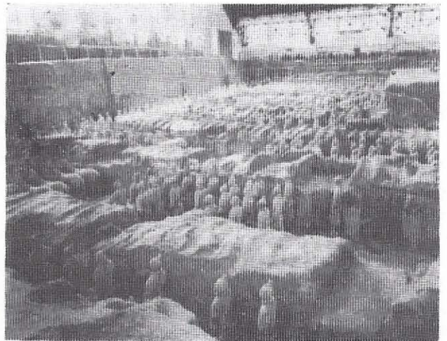
Λιτανεία γιὰ τὴ σφαγὴ τοῦ Πεκίνου 1 .

Ἐμεῖς, ἔχοντας κεφαλοδέσει μὲ πένθιμες κορδέλλες, δεόμεθα ἀπὸ τὴν ἔρημη πιά Πλατεία τῆς Οὐράνιας Ἀναταραχῆς νὰ λάμψει ἕνα Μεγάλο Φῶς σ' αὐτούς, ποὺ κάθονται στὴ σκιερὴ χώρα τοῦ Θανάτου κι ὁ πηλὸς ν' ἀφθαρτοποιηθεῖ. Αἰωνία ἡ μνήμη σας, Ἀδέλφια τῆς Ἀνατολῆς!