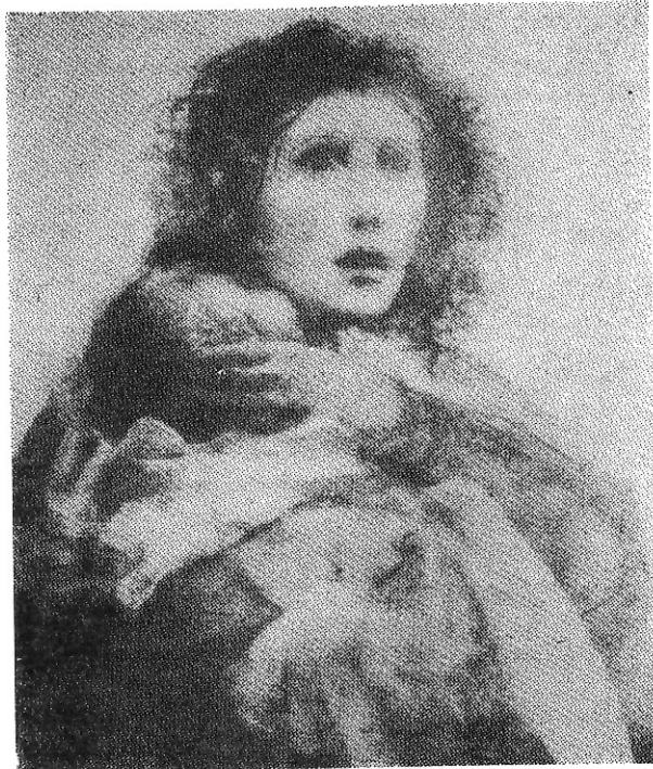
Το εξώφυλλο του Προγράμματος. Χαρακτικό του Pietro Annigoni.

λικού Πανεπιστημίου del Sacro Cuore που έδρεύει στη Ρώμη. Οι υπόλοιπες σχολές, των έπιστημών του ανθρώπου του ίδιου Πανεπιστημίου βρίσκονται στο Μιλάνο. Το Κέντρο αυτό ιδρύθηκε το 1985 και αναπτύχθηκε υπό την καθοδήγηση του δραστήριου διευθυντού του καθηγητού Mgr. Elio Sgreccia σε σημαντικό πεδίο έρευνας, διδασκαλίας και εκδόσεων για θέματα βιοηθικής στην Ιταλία 2 .