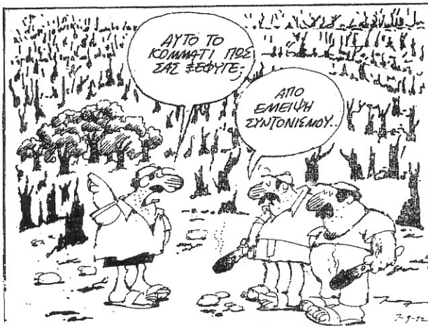
Σκίτσο τοῦ Ἄντ. Καραμάρα. «Ἡ Καθημερινή», Τρίτη 8 Σεπτεμβρίου 1992.

«Ἀπὸ τὴν ἀπελευθέρωσή τους κι ὕστερα οἱ Ἕλληνες παλεύουν νὰ ξαναδώσουν ζωὴ στὴ γῆ. Ἡ γίδα ἔχει γίνει πιά ἐθνικὸς ἐχθρός. Θὰ τὴν διώξουν μὲ τὸν καιρὸ, ὅπως ἔγινε μὲ τοὺς Τούρκους. Ἡ γίδα εἶναι τὸ