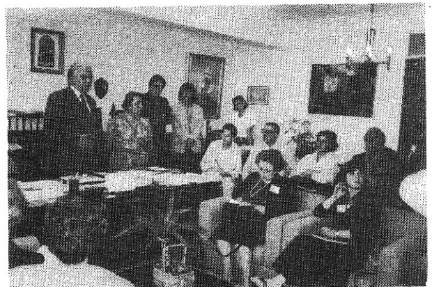
Μὲ τὴν ἡγεσίαν τοῦ Ὑπουργείου...

Ἡ Ἐκκλησία ποὺ μὲ πολλὴ συμπάθεια παρακολουθεῖ κάθε ἐνέργεια ποὺ γίνεται γιὰ τὸ καλὸ τῆς οἰκογένειας δὲν μπορεῖ νὰ δεῖ παρὰ μὲ πολὺ καλὸ μάτι