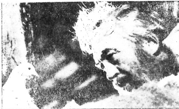
Ἄ Τζῶν Χιούστον ὡς Νῶε.

Ἄνεξιτηλη παραμένει σὰ μάτια μας ἡ εἰκόνα τῆς ἀλεπουδίτσας στήν τηλεόραση, πού ἀμήχανη, περικυκλωμένη ἀπό τίς φλόγες, προσπαθοῦσε νά ξεφύγει καί νά σωθεῖ ἀπό τή φωτιά. Στούς θλιβεροὺς ἀπολογισμοὺς τῶν τελευταίων πυρκαγιῶν ἐγγράφονται καί οἱ ἀπώλειες μεγάλου μέρους τῆς πανίδος τῶν περιοχῶν πού πυρπολήθηκαν. Ἡ «ἐλείμων καρδιά» μας ὀδυνᾶται μπροστά στή θέα αὐτῆς τῆς καταστροφῆς πού ἀντανάκλα τὴν σκληροκαρδίαν ἡμῶν.