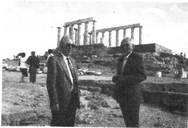
Τὸ τέλος τοῦ ταξιδιοῦ. «Ὡ ξεῖν...»!

Φεύγοντας πρέπει νὰ εἶχε τὸ συναίσθημα ὅτι οἱ Ἕλληνες ποὺ τὸν ὑποδέχτηκαν «τοῦ ἄνοιξαν νὰ ξαναδεῖ σὲ τὶ μεριὲς μεγάλωσε...» 2 , σ' αὐτὸν ποὺ ἀνατράφηκε μὲ τὴν Καινὴ Διαθήκη καὶ τοὺς Ἀρχαίους. Ἐμεῖς θέλουμε νὰ τὸν διαβεβαιώσουμε ὅτι τὸν νιώθουμε δικό μας κι ὄχι ξένο. Παρ' ὅλ' αὐτὰ θὰ ἀπευθυνθοῦμε σ' αὐτὸν μὲ τὸ γνωστὸ «ὦ ξεῖν», καὶ θὰ τὸν παρακαλέσουμε ν' ἀναγγεῖλει στοὺς συμπατριῶτες του Εὐρωπαίους, ὅτι ἡ Ἑλλάδα —καὶ ἡ Ὀρθοδοξία— «οὔτε λέγει οὔτε κρύπτει, ἀλλὰ σημαίνει» 3 . Πιστεύουμε ὅτι σ' αὐτὸ τὸ μικρὸ τμήμα τοῦ βίου του ποὺ ἐξῆσε στὸν τόπο μας βίωσε πολλὰ, γι' αὐτὸ μπορούμε νὰ συνεχίσουμε τώρα καὶ μὲ λίγα βιο - βιβλιογραφικά, ὥστε νὰ ἀποκομίσουν οἱ ἀναγνώστες μιὰ σχετικὰ πληρέστερη εἰκόνα γι' αὐτὸν καὶ τὸ ἔργο του.