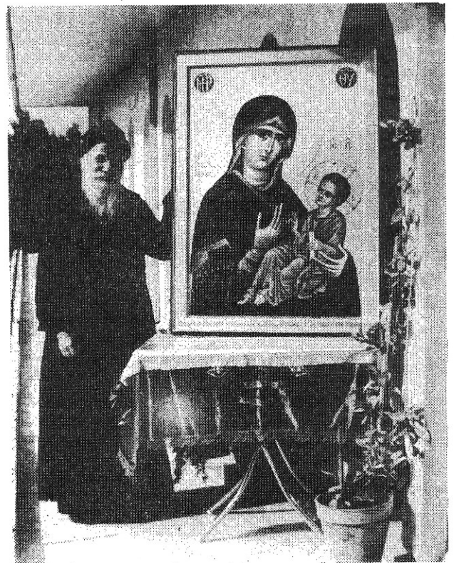
Ὁ Γέροντας Πορφύριος (1906 - 1991), μᾶς ὁδηγεῖ μὲ τὴ βοήθεια τῆς Ὁδηγήτριας στὸν ἀληθινὸ δρόμον τῆς ζωῆς πού εἶναι ὁ Χριστός.