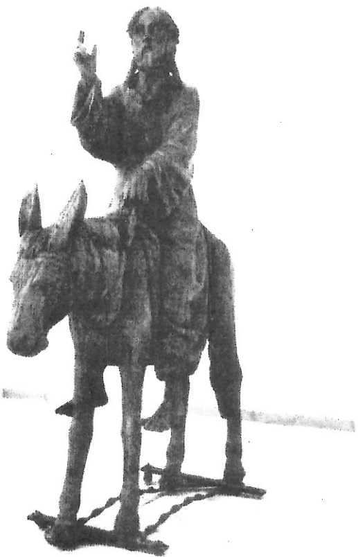
Ο Χριστός των Βαϊων. Ξυλόγλυπτο από δρυ. Μισό του 16ου αιώνα. Βόρεια Γαλλία. Μουσείο της Louvain - la - Neuve.

Ο ώραϊος αυτός λόγος και οι τολμηρές του παρομοιώσεις μ' έκαναν κι έμένα να θελήσω να περιλάβω στο σημερινό μου σημείωμα ένα ποιητικά άρθρωμένο