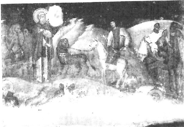
Ἀπὸ τὸν βίο τοῦ ἁγίου Γερασίμου (14ος αἰών). Θεσσαλονίκη, Ἁγ. Νικόλαος Ὁρφανάς.

τούντα μοναχὸ τὴν τελευταίη του καὶ πηγαίνοντας στὸν τάφο καταθρήνησε στὴν ἀρχὴ μὲ λεπτὰ βρυχήματα καὶ ἔσυρε στὸ τέλος μεγάλο βρυχηθμὸ καὶ ἀφήκε τὴν πνοή. Ὁ Συναξαριστὴς καταλήγει: « Οὕτω δοξάζει ὁ Θεὸς τοὺς δοξάζοντας αὐτόν, καὶ θήρας αὐτοῖς ὑπέκρινεν παρασκευάζει, διατηροῦσι τὸ κατ' εἰκόνα καὶ καθ' ὁμοίωσιν ἄσπιλον » 4 .