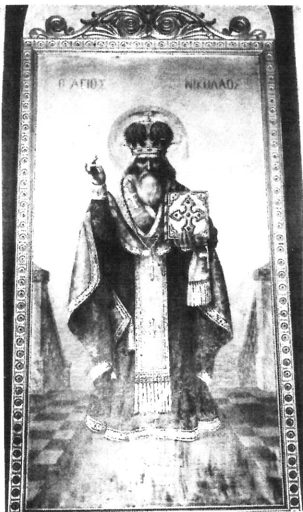
Ὁ Ἅγιος Νικόλαος.

Εἰκονίζεται σὲ μεγαλόπρεπη στάση, εὐλογῶν καὶ αὐστηρὸς σὰν Ρώσσοις Ἐπίσκοπος. Τὸν Ἅγιο Νικόλαο θὰ συναντήσωμε σὲ ὅλα τὰ ἐμπορικὰ κέντρα τῶν ἀποδήμων Ἑλλήνων. Στὸν πίνακα αὐτὸν γίνεται ἔντονα ἐμφανὴς ἡ χρῆσις τῆς τεχνικῆς