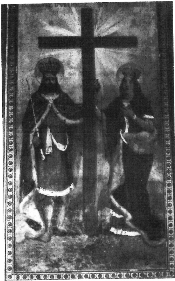
Οἱ Ἅγιοι Κωνσταντίνος καὶ Ἑλένη.

Οἱ Ἅγιοι ἀπεικονίζονται κατὰ τὴν συνηθισμένη παράσταση μὲ ἐντονη τὴν δυτικὴ φαντασία, καλοδουλεμένοι ἀπὸ πλευρᾶς ἐνδυμάτων. Τὸ ἔργο ἱστορήθηκε πρὸς τιμὴν τοῦ Κωνσταντίνου Τυφόξυλου, ἐπιφανοῦς μέλους τῆς Κοινότητος. Ὁ Κ. Τυφόξυλος γεννήθηκε στὴν Κοζάνη τὸ πρῶτο ἡμῶν τοῦ 19ου αἰῶνα καὶ μαζὶ μὲ τὸν ἀδελφὸ του Ἐμμανουήλ, ἐπεδόθησαν σὲ ἐμπορικὲς ἐπιχειρήσεις