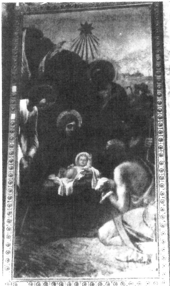
Ἡ Προσκύνησις τῶν Ποιμένων.

τὴν ἀναπνοὴν των» ἐπιμένει ὁ φανατικὸς στὰ παραδοσιακὰ Φ. Κόντογλου— ἀλλὰ ἡ ἴδια ἡ ἀγκάλη τῆς Θεοτόκου γίνεται λίκνον γιὰ τὸν Ἀχώρητον Υἱὸν Της.