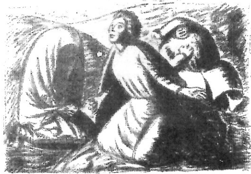
Ἔρνεστ Μπάραλα, Ἐλπίδα καὶ ἀπελπισία II, 1931, λιθογραφία.

γράφουν μὲ κεφαλαῖο Χ. Καὶ οἱ ἐπὶ μέρους Ἐκκλησίες ἐτοιμάζονται κι αὐτὲς μὲ βῆμα ταχὺ γιὰ νὰ ἀσκήσουν τὴν Ποιμαντικὴ τους καὶ στὴν χιλιετία ποὺ ἀνατέλλει, θεμελιωμένη ὁμως θεολογικὰ σὲ μιὰ Θεολογία ποὺ θὰ στοχάζεται καὶ θὰ ἐνεργεῖ ἐν ὄψει αὐτῆς τῆς τρίτης χιλιετίας 5 . Μεταξὺ ἄλλων ἔχει ἤδη προγραμματιστεῖ γιὰ τὸ 1997 στὴν Ἀγγλία ὁμότιλο συνέδριο ( Towards the Millenium ) τῆς Εὐρωπαϊκῆς Ἐπιτροπῆς Ποιμαντικῆς Φροντίδας καὶ Συμβουλευτικῆς.