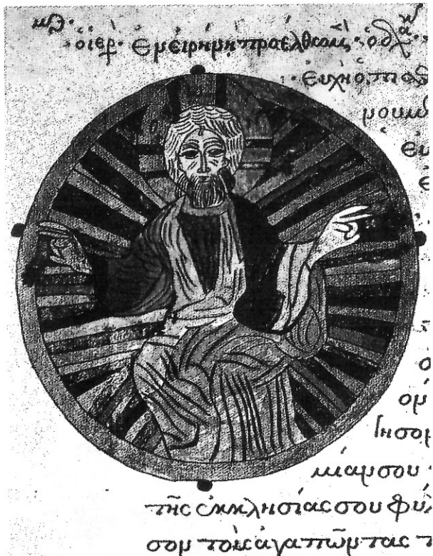
Χριστὲ ὁ Θεός, ἡ ἐλπίς ἡμῶν, μὴ ἐγκαταλίπῃς ἡμᾶς τοὺς ἐλπίζοντας ἐπὶ σέ. Ἐγχρωμη μινωγραφία ἀπὸ τὸν ὑπ' ἀριθ. 129 κώδικα τοῦ Ἁγίου Ὁρους, φύλο 47 V.

ξων μεταναστών στο Νέο Κόσμο είχαν απόλυτη ανάγκη την έλπιδα που προσέφερε η αμερικανική κοινωνία. Σήμερα οι ὀρθόδοξοι αισθάνονται ότι μπορούν να προσφέρουν στην αμερικανική κοινωνία την έλπιδα που έχει ανάγκη, και περιέχεται στη δική τους πνευματική παράδοση» 10 .