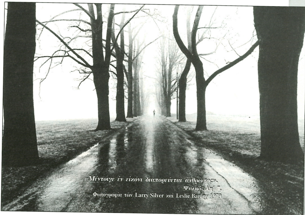
«Μέντοιγε ἐν εἰκόνι διαπορεύεται ἄνθρωπος» Ψάλλος Λη 7. Φωτογραφία τῶν Larry Silver καὶ Leslie Barany 1979

γ. Γενικὰ παρατηροῦμε ὅτι ἡ στημένη φωτογραφία προκαλεῖ ἀδιαφορία ἢ καὶ ἐκνευρισμό. Τὰ τοπία ἐπίσης προξενοῦν συχνὰ τὴν ἀδιαφορία τοῦ θεατῆ. Ἡ κακὴ ἐντύπωση ὡστόσο ἀμβλύνεται ὅταν τὰ τοπία