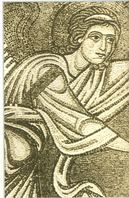
«Ἄγγελος Κυρίου» – «Ψηφιδωτὸ ἀπὸ τὸ παρακλήσι τοῦ...

ταξὺ τῶν «εὐλογημένων τοῦ πατρός», τῶν δικαίων, καὶ τῶν «κατηραμένων». Ἀνεξάρτητα ἀπὸ τὸ πού «ἀπελεύσεται» ἡ κάθε κατηγορία ἀνθρώπων μετὰ τὴν ἡμέρα τῆς μελλούσης κρίσεως – εἰς κόλασιν ἢ εἰς ζωὴν αἰώνιον – θὰ πρέπει νὰ συνειδητοποιηθεῖ ὅτι ἐκεῖνο πού κάνει τὴ ζωὴ τῆς γῆς ζωὴ ἢ κόλαση εἶναι ἡ παρουσία ἢ ἡ ἀπουσία τῆς ἀγάπης. Αὐτὸ ἄλλωστε εἶναι τὸ οὐσιαστικὸ μῆνυμα αὐτῆς τῆς περικοπῆς. Τὸ ἀποτέλεσμα εἶναι ἀπλῶς