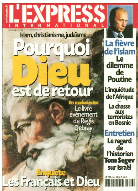
Γιατί ὁ Θεὸς ἐπιστρέφει. Ἐξώφυλλο τοῦ «L'Express» τῆς 1ης Νοεμβρίου 2001.

Ἔτσι, ἔρευνα τοῦ 1992 δείχνει ὅτι τὸ 89% τῶν ἐρωτηθέντων –πιστῶν καὶ μὴ πιστῶν– ἀπὴν-