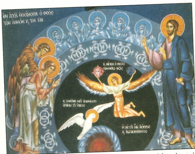
Δημιουργία... «Ἐν ἀρχῇ ἐποίησεν ὁ Θεὸς τὸν Οὐρανὸν καὶ τὴν γῆν». Τοιχογραφία στὴν Ἱ. Μονὴ τοῦ Ἁγίου Ἰωάννου τοῦ Μαζαρινοῦ.

Ἄντι να ἀντιπαραθέτουμε ὡς συνήθως τὴν έπιστήμη με τὴν θρησκεία ἢ να θεωροῦμε ὅτι αὐτὲς συνιστοῦν δύο σύνολα, δύο μεγέθη ἀλληλοσυμπληρούμενα ἢ ἀλληλοαποκλειόμενα μποροῦμε να ὑποστηρίξουμε ὅτι μυστηριωδῶς γονιμοποιοῦν ἡ μία τὴν ἄλλη και ἀλληλοπεριχωροῦνται, χωρὶς να εἶναι ἀναγκαῖο και να τίς ἱεραρχοῦμε, δάζοντας τὴ μία πάνω στὴν ἄλλη.