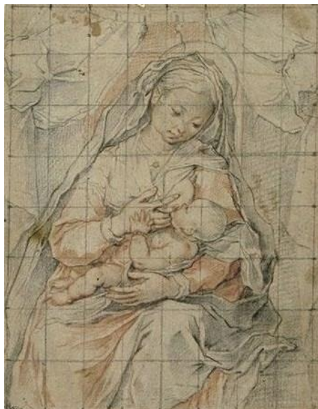
Salimbeni Ventura (1567-1613)