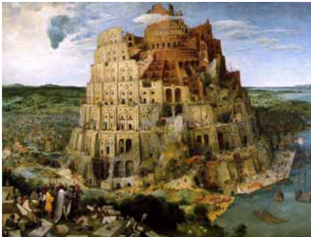
Ὁ Πύργος τῆς Βαβέλ: Pieter Bruegel ὁ Πρεσβύτερος ( 1563) Ἱστορικό Μουσεῖο Τέχνης - Βιέννη

Οἱ πολιτισμοὶ ἐκφράζονται μέσῳ πολυφωνικῶν δυναμικῶν ἐκδηλώσεων τῆς πολλαπλότητας, φωνῶν ποὺ δὲν ἐκτρέπονται στὴν ἐνικότητα, ὅπου ἡ συμβολὴ τῶν ἀτόμων και τῶν ομάδων εἶναι μοναδικὴ και ἀναντικατάστατη, και δὲν μπορεῖ νὰ νοηθεῖ ἔξω ἀπὸ τὴ σχέση πρὸς τὴ φύση ὡς ζῶσα ὄντοτητα. Μπορεῖ νὰ εἶναι χρήσιμο νὰ σκεφθοῦμε ἐκ νέου τίς κοινότητες ὡς συμπαγεῖς χώρους τοῦ κοινωνικοῦ, ὅπου, ἐν μέσῳ συμφωνιῶν και διαφωνιῶν, καταγράφονται μὲ τρόπο δημιουργικὸ καινούριες ἐκδοχὲς ἀνθρώπινης συνύπαρξης.