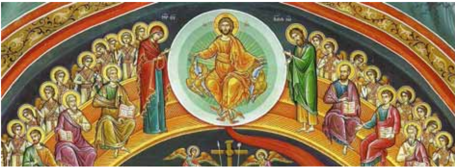
Παράσταση τῆς Μελλούσης Κρίσεως (Λεπτομέρεια: Δέηση) Καθολικόν (Ι. Ν. Ἀγίου Χαραλάμπους) τῆς Ἱ. Μ. Ἀγίου Στεφάνου Μετεώρων, τοῦ ἀγιογράφου-ψηφιδογράφου Βλάσιου Τσοτσάνη (1991).

Στὶς μεταξὺ τῶν ἀδελφῶν σχέσεις ὑπάρχει πάντοτε μιὰ κάποια ἀμφιθυμία καὶ ἀμφισημία. Αὐτὸ φανερώνεται στὴν πρώτη ἀδελφοκτονία (Γένεσις 4, 1-16).