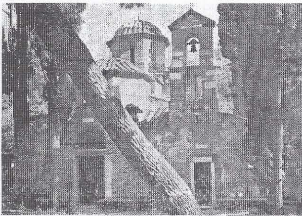
Τὸ μοναστήρι τῆς Καισαριανῆς. Στὸν περίβολό του ἔγινε ἡ τελετὴ τοῦ Ἐδχελαίου.

Τελευταῖα, ὅπως πληροφοροῦμεθα, ὄλο καὶ περισσότεροι χριστιανοὶ ἐπιζητοῦν τὴν ἔλση ἐδχελαίου σὶὰ σπῖτια τους. Αὐτὸ συμβαίνει ἰδιαίτερα σὶς περιόδους πρὶν ἀπὸ τὰ Χριστούγεννα καὶ τὸ Πάσχα. Εἶναι ἐπίσης πολλοὶ ἐκεῖνοι ποὺ μεταβαίνουν σὶς Ἰ. Ναοὺς τὸ ἀπόγευμα τῆς Μ. Τετάρτης γιὰ νὰ παρακολουθήσουν τὴν σχετικὴ ἀκολουθία καὶ νὰ χρυσθοῦν. Πολλοὶ ἀπὸ τοὺς ἱεροεῖς μας σνηθίζουσι, διὰν τοὺς προσκαλοῦν γιὰ ἐδχελαίσι σὶὰ σπῖτια, νὰ συζητοῦν μετὰ τοὺς πιστοὺς πάνω σὶ τὸ νόημα τῆς ἀκολουθίας καὶ τῶν ἐπὶ μέρους σιτιγμῶν τῆς. Κατὰ τὴ συζήτηση δίδεται ἐπίσης ἡ ἐδκαιρία νὰ θυγοῦν, πέρα ἀπὸ τὰ προβλήματα ποὺ φέρνει μαζί τῆς ἡ ἀρρώστια, διὰν ὑπάρχει συγκεκριμένη περίπτωση ἀσθενοῦς, καὶ ἄλλα ζητήματα ποὺ ἀπασχολοῦν τὴν οἰκογένεια ἢ ἐρωτήματα ποὺ ἀφοροῦν σὶ τὴν πίστι καὶ τὰ ὁποῖα μετὰ ἀφορμὴ τὰ ὅσα σημαντικὰ τελεσιουργοῦνται κατὰ τὸ Μυστήρισι ἔρχονται σὶ τὴν ἐπιφάνεια καὶ περιμένουν ἀπαντήσεις.