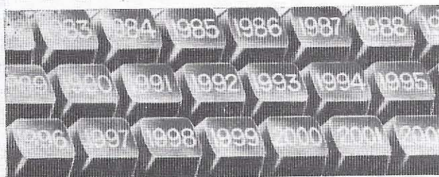
Ο Έκκλησιαστικός Τύπος στα πρόθυρα της τρίτης χιλιετίας...

Πώς θα μπορέσει να διερμηνεύσει αυτός ο Τύπος τον Λόγο του Θεού προς οικοδομή του πληρώματος της Έκκλησίας, παράκληση του χαιμαζόμενου και πειρα- ζόμενου λαού και να γίνει υπογραμμός της νέας ζωής, ιδιαίτερα κάτω από την προοπτική της άρχουσας, σε σύνταμο σχετικά χρονικό διάστημα, τρίτης χιλιετίας;