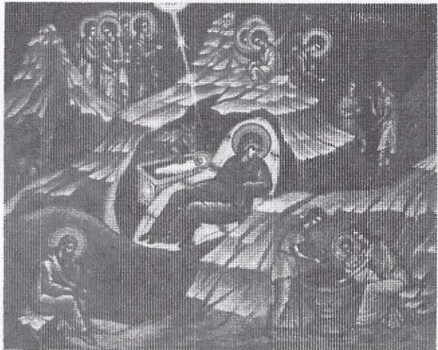
«Ότι έτέχθη έμιν σήμερα σωτήρ».

συμφώνησαν οι σύεδροι: να προωθήσει ή έκλεγείσα έκτελεστική επιτροπή, ή όποια και θα ένγμερώσει: υπεύθυνα σε συνεργασία με τη συνητοπιστική επιτροπή του συνεδρίου τις Έκκλησίες Ελλάδας, Κύπρου, Κρήτης και το Οικουμενικό Πατριαρχείο, και θα ζητήσει: να εύλογήσουν την έλη προσπάθεια έπ' αγαθού της Έκκλησίας, όπως σημειωνόταν στο δελτίο τύπου που κυκλοφόρησε αναφορικά με την πρόοδο των έργασιών του Συνεδρίου.