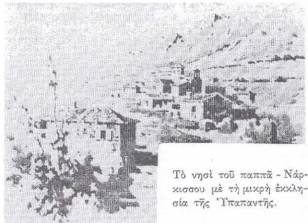
Τὸ νησί τοῦ παπᾶ - Νάρκισσου μὲ τὴ μικρὴ ἐκκλησία τῆς Ἰσαπαντῆς.

Τέτοια κείμενα πού δροσιζοῦν τὸ πνεῦμα μισορούνη στὴν ἀπλότητα καὶ ἀφελότητα τους γὰ ἐμπνέουν καὶ γὰ καθοδηγοῦν ἀκόμα καὶ σήμερα. Ἄλλωστε ἡ γνώση τῆς ἱστορικῆς πραγματικότητος δὲν στέκεται ἐμπόδιο στὶς τοιμὲς πού μπορούν ἢ εἶναι ἀναγκαῖο νὰ γίνου γὰ σύγχρονες ἐποχὲς.