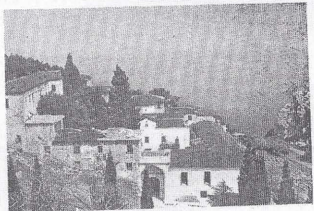
Ἡ Ἱερά Μονὴ Μεταμορφώσεως τοῦ Σωτῆρος, ἔξι χι- λιόμετρα ἀπὸ τὴν Κύμη. Ἀποψη ἀπὸ ἀνατολικὴ πλευρά.

συγκεκριμένο τρόπο ἢ ἀκόμα καὶ διαφορετικῶς, κατὰ τὸ πρότυπο τῆς «ἐλεήμονος καρδίας» ποὺ ὑποδεικνύει ὁ Ἀββᾶς Ἰσαάκ ὁ Σύρος (Λόγος ΠΑ'), μπορεῖ νὰ ἐξηγήσουν τὰ ἀνεξήγητα ἐκ πρώτης ὄψεως περιστα- τικά μεταστροφῆς, ἐπιστροφῆς καὶ ἐπισυναγωγῆς εἰς τὴν ἁγίαν μας Ἐκκλησίαν τῶσων ἀδελφῶν μας.