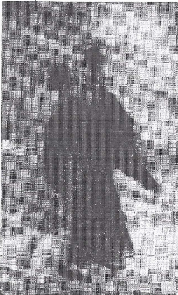
Πρεσβύτερος - Πρεσβυτέρα: Κοινὴ κλήση, κοινὴ πορεία, σὲ ἐποχὲς μετασχηματισμῶν... 3 .

Φαίνεται ὅτι δίπλα στὶς ἱερατικὲς κλήσεις ἐξίσου σημαντικὴ εἶναι καὶ ἡ κλήση τῆς πρεσβυτέρας.