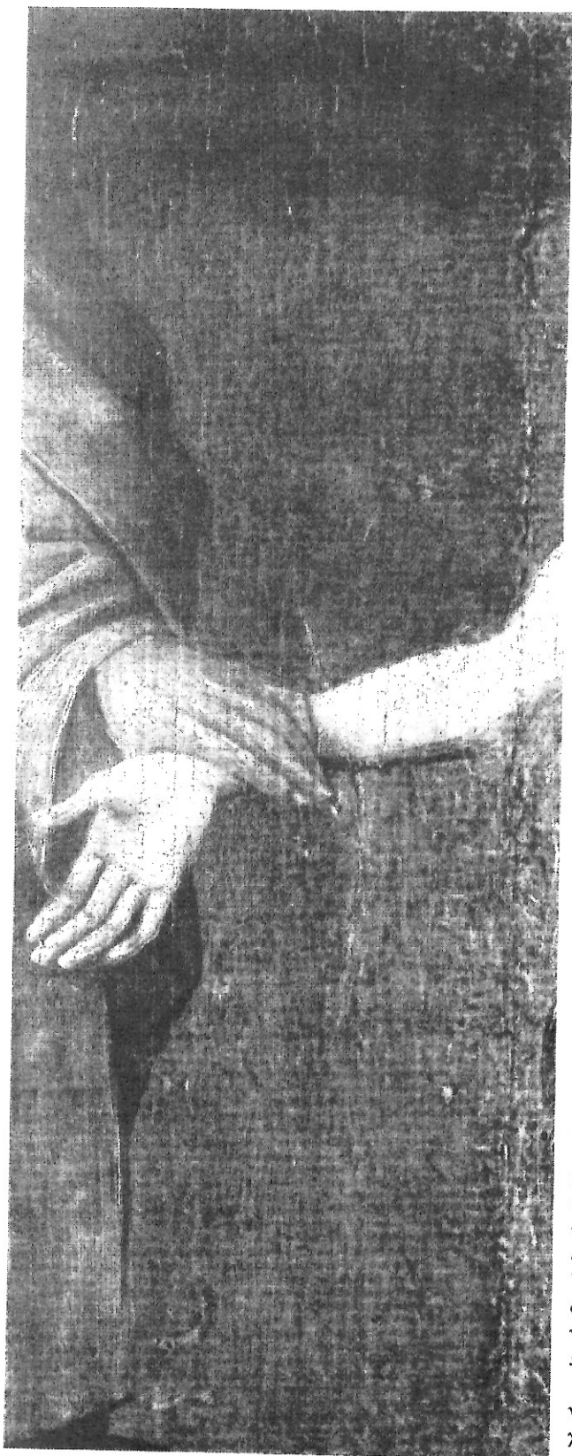
Ο Δημιουργός χειρο-αγωγεί την Εύα. Λεπτομέρεια από πίνακα του Ίερωνύμου Μπότς (Bosch).

προσπαθώντας να με βηματίσεις έξω απ' τη μεγάλη νύχτα 14 .