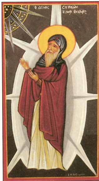
Ο άγιος Συμεών ο Νέος Θεολόγος μέσα στο άκτιστο φώς. Έργο του Άγιογράφου τής όμωνύμου Μονής στον Κάλαμο Άττικής