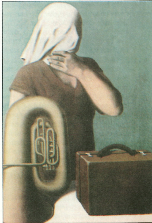
René Μαγκρίτ, «Κεντρικὴ Ἱστορία»

Ἐκεῖ, θ' ἀνακαλύψουμε τὴν στολή τὴν πρώ- τη, τὴν ἀποτυπωμένη σφραγίδα μὲ δακτυλίδι