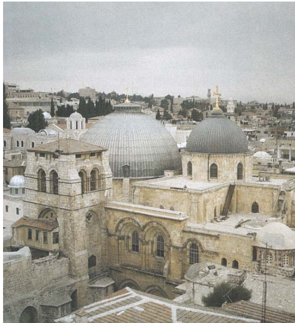
Ὁ Πανίερος Ναὸς τῆς Ἀναστάσεως στὰ Ἱεροσόλυμα.

Ἡ ὥρα τοῦ θανάτου εἶναι ἡ πιὸ φρικτὴ. Ὅλα αὐτὰ συμβαίνουν αὐτὴν τὴν ὥρα καὶ ἐμεῖς δὲν παίρνουμε εἶδηση. Ἡ Ἐκκλησία μας, ὅμως, πού διδάσκει αὐτὰ μᾶς προτρέπει νὰ εὐχόμεστε για τὴν ὥρα τοῦ θανάτου μας. Καὶ πρῶτα