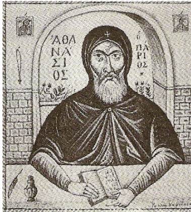
ΕΝ ΤΡΙΕΣΤΙΩ 1802